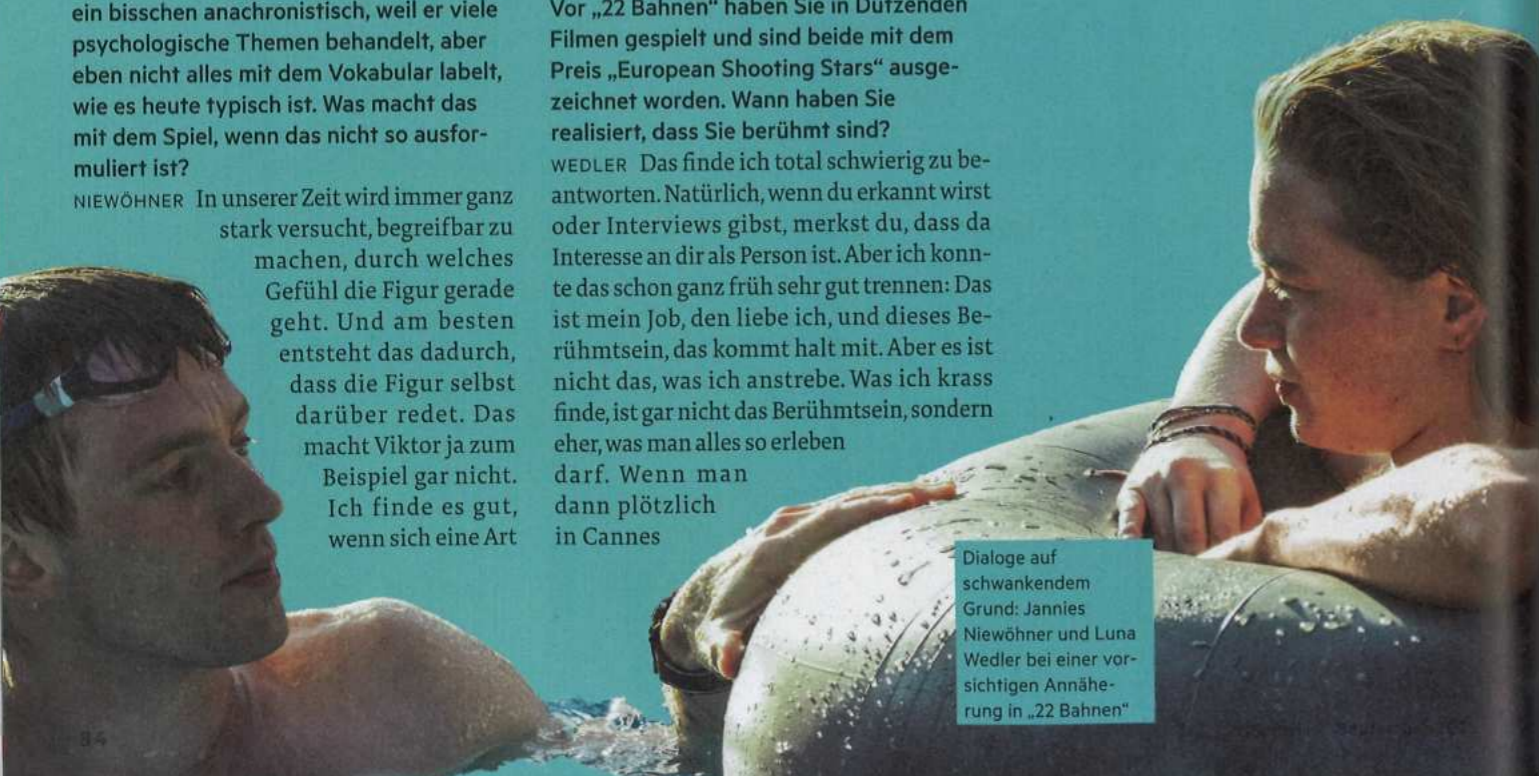
Dialoge auf schwankendem Grund: Jannis Niewöhner und Luna Wedler bei einer vorsichtigen Annäherung in „22 Bahnen“

NIEWÖHNER Ja, so ein Musikfilm wäre auch spannend. Ich glaube, du solltest noch mehr singen.