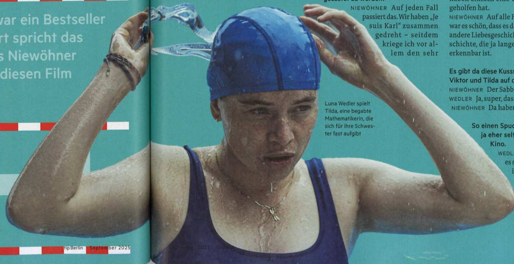
Luna Wedler spielt Tilda, eine begabte Mathematikerin, die sich für ihre Schwester fast aufgibt

WEDLER Aber deswegen ist es so schön, dass das drin ist. Ich finde es so wichtig, dass wir mehr solche Filme haben – und auch Sexszenen. Das ist ja niemals immer so perfekt wie