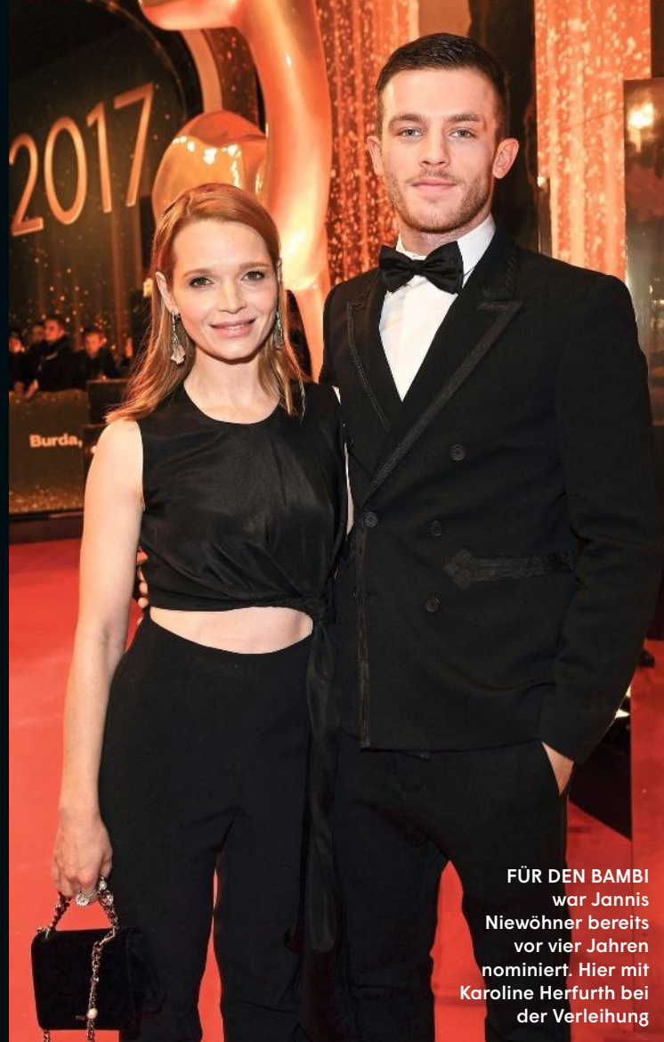
FÜR DEN BAMBI war Jannis Niewöhner bereits vor vier Jahren nominiert. Hier mit Karoline Herfurth bei der Verleihung

ZU HAUSE KOMME ICH BEI MEINEN WURZELN AN UND TANKE KRAFT. DAS IST WICHTIG FÜR MICH