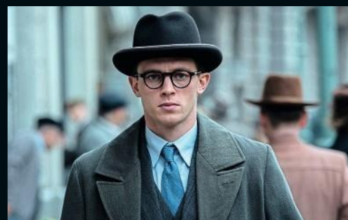
MÜNCHEN – IM ANGESICHT DES KRIEGES In dem Thriller spielt er einen Diplomaten (ab 21. 1. auf Netflix)