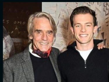
LONDON-PREMIERE mit Oscar-Preisträger Jeremy Irons, der in „München“ den britischen Politiker Chamberlain spielt