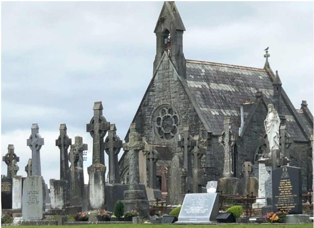
Mystische Orte überall, wie der historische Friedhof Bohernmore mit der traditionellen Kapelle in Galway. Die Küstenlandschaft ist vor allem in den Abendstunden reizvoll