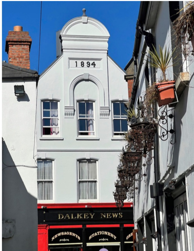
Nah dran: Hier entstehen die aktuellen Schlagzeilen aus dem Küstenort. Und wo wird darüber diskutiert? Natürlich in einem typischen Pub bei einem Guinness