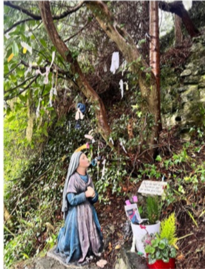
Traditioneller Marlen-Schrein, wie man sie an vielen heiligen Quellen in Irland findet

„Irland schafft es immer, mich tief zu berühren“