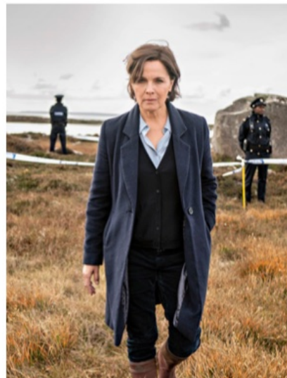
Wieder ist die Hafenstadt Galway Schauplatz der Reihe mit Désirée Nosbusch als Polizeipsychologin Cathrin Blake: Am 9. April läuft „Die Tote am Fluss“ und am 16. April „Du gehörst mir“ in der ARD

„Irland schafft es immer, mich tief zu berühren“